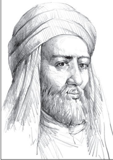
■ ابن خلدون