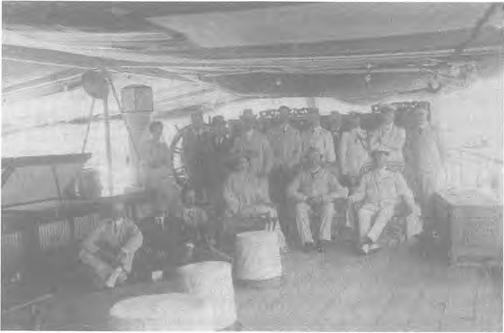
(اللورد والليدي كورزون على سطح السفينة خلال جولتهما في الخليج، 1903)

أخ زوج إيميلي لوريمير - جون غوردن لوريمير - وكان القصد من زيارته توثيق الأحداث للأجيال القادمة، فضلاً عن جمع معلومات لكتاب مرجعي حول المنطقة. وكان نتاج بحث لوريمير كتاباً يُعدُّ واحداً من أعظم الكتب على الإطلاق حول الجزيرة العربية، وحمل عنوانه اسم (المعجم الجغرافي للخليج العربي، وعمان ووسط الجزيرة العربية). تحدث لوريمير، في ملحق الكتاب عن جولة نائب الملك والعلاقات البريطانية مع الحكام المحليين ورعاياهم. وكان حديث لوريمير مثلاً حياً للسرد التقليدي «للتأريخ الإمبريالي»، الذي كان يعكس بشكل غير واعٍ، ضيق أفق المؤلف الذكر تجاه وجود بريطانيا في الخليج (1) .