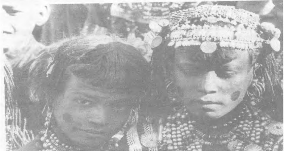
امرأة تحمل الماء في المكلا وبتنين من حريضة، صورتها فريا ستارك خلال رحلاتها في جنوب جزيرة العرب، 1938

عرف عنها لدى أصدقائها، ومعارفها، لاحقاً أنها وغاردينير» كانتا سعيدتين جداً عندما ذهبت». وهذا ما منحهما بعض الوقت للشفاء من الحمى، وأمراض الحنجرة دون شقاق في أثناء غياب فريا (1) . وبعد مضي شهر، كانت ستارك قد عادت، ومرضت مرة أخرى بالنومونيا كما كانوا يتوقعون. اضطرت المرأة، وكانت حينها في حريضة، للاتصال بأقرب