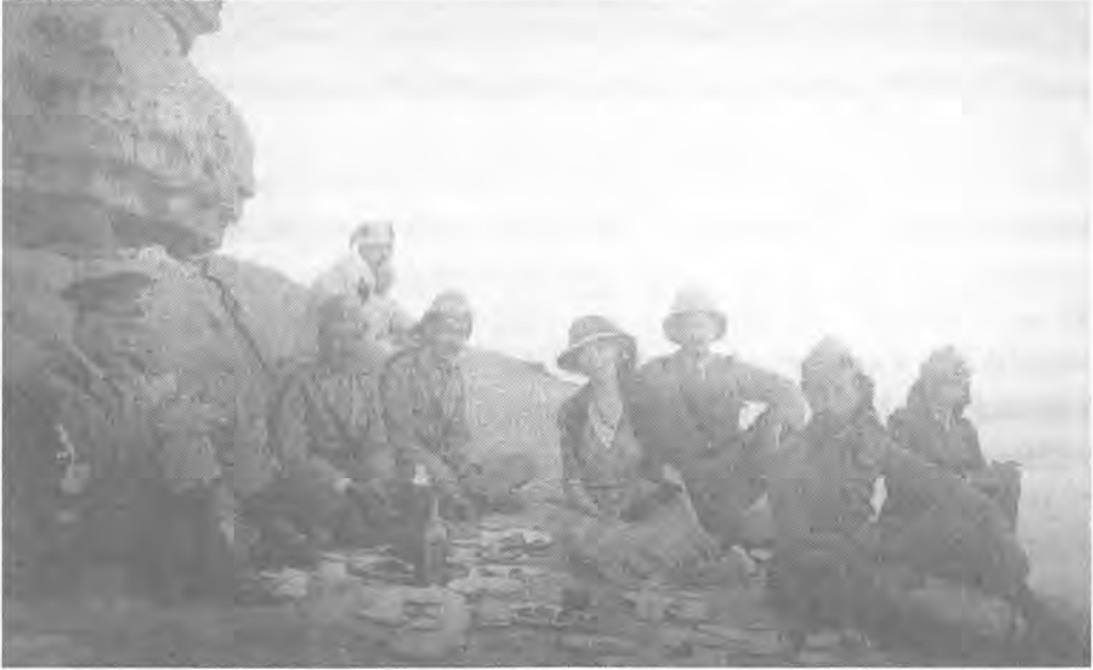
غيرترود بيل في نزهة مع الملك فيصل الأول ملك العراق (إلى اليمين في المقدمة) وغيرها من الموظفين البريطانيين في بدايات 1920.

موضوع لـ«الاكتشاف» والتعاطف فضلاً عن أنها مجموعة مُتابعة وسهلة الانقياد. خطت بيل في فبراير من عام 1920، رسالة بعثت بها إلى صديقتها فالتين شيروول، وصفت فيها اهتمامها الجديد: