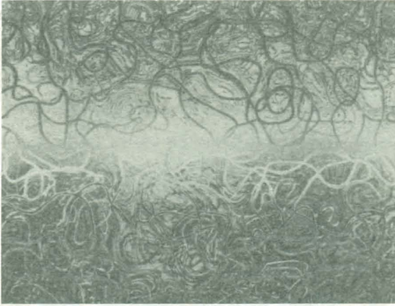
شكل ٢: عمل فني متطور. حقوق الملكية محفوظة لكارل سيمز Karl Sims، واستخدمت بناءً على تصريح منه.

تنازل أسلوب دوكينز في فهم التطور عن مسئولية التوليد للحاسوب الذي يغير عشوائياً (وليس عمداً) الفرد المنتخب، ويحتفظ الفنان فقط بحق فحص هذه الأشكال المعدلة واختيار أيها سيُنسخ (بصورة خاطئة) إلى الجيل التالي.