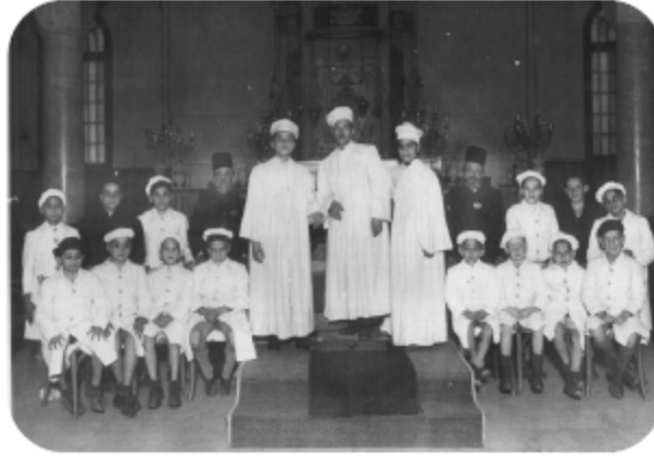
جوقة من يهود الإسكندرية في كنيس صموئيل منشه

في حوالي عام ٦٥٠ قبل الميلاد، خلال عهد منسي، شارك الجنود اليهود في حملة بسماتيك الأول على النوبة. تأثر نظامهم الديني بفترة وجودهم في بابل حيث تعددت آلهتهم (32) ، فعبدوا الإله «المحلي» «خنوم» في معابدهم الخاصة، جنباً إلى جنب عبادتهم للرب «يهوه» استقر اليهود خلال العصر