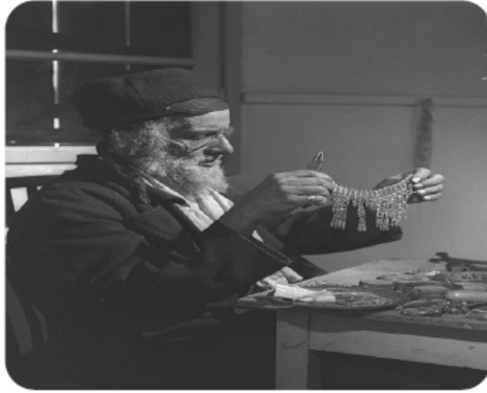
صانع يهودي يماني في متجره في إسرائيل عام ١٩٥٨

تاريخياً، يعود وجود اليهود في تونس إلى القرن السادس قبل الميلاد، تزامناً مع خراب هيكل سليمان، حيث وجدت أقدم الآثار الماديّة للمعابد اليهوديّة قرب حمام الأنف، أو قليبيّة، على الساحل الجنوبي لتونس، وتعود إلى الفترة الرومانيّة.