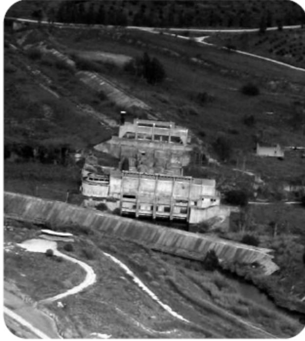
بقايا محطة توليد الطاقة في الباقورة، تابعة لمشروع روتنبرغ

المواشي. إلا أن إسرائيل احتلت المنطقة الواقعة على الجانب الأردني عند ملتقى نهر اليرموك ونهر الأردن في غرب الباقورة عام ١٩٥٠ التي كانت مسجلة باسم بنحاس روتنبرغ اليهودي(338)، الذي منحته بريطانيا في عام ١٩٢١ حق امتياز استغلال مياه نهري اليرموك والأردن لتوليد الطاقة الكهربائية لإنارة المدن الفلسطينية ولواء عجلون ضمن ما كان يُسمى مشروع روتنبرغ(339).