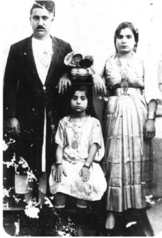
عائلة من يهود ليبيا

ويرجع الفضل في تأسيس أول رابطة صهيونية في طرابلس (وهي «رابطة صهيون») إلى المصور اليهودي إياهو نحمياس، وهو مصور صحفي عمل لصالح صحيفة «يسرائيل» (إسرائيل) الصادرة في برنتسا الإيطالية (524) ، وإن كان الاهتمام الصهيوني بليبيا يعود إلى وقت مبكر أثناء التفكير والسعي لتنفيذ «مشروع برقة» لإقامة دولة يهودية هناك. عملياً، بداية دخول الصهيونية إلى ليبيا كانت مع القوات اليهودية المدمجة في الجيش البريطاني، خلال عامي ١٩٤١ - ١٩٤٢، إلى إقليم برقة حيث اختلطوا باليهود المحليين، وتزوج بعض أفرادهم من يهوديات ليبيا، وقامت هذه القوات بدور تعليمي وثقافي وديني في درنة وبنغازي.