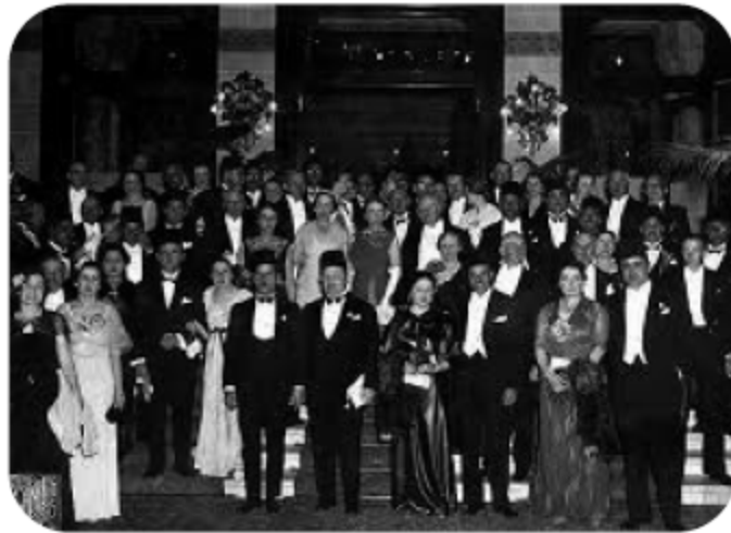
صورة جماعية لعدد من يهود مصر

ويعتقد موريس مزراحي «أن اليهود لعبوا دوراً مهماً في تنمية الاقتصاد المصري» (88) . وإذا كانت العائلات الغنية اليهودية كسبت مبالغ طائلة من أعمال الصرافة، والبنوك، وشراء الأراضي، وإنشاء مصانع السكر، وشركات النقل، فإن نشاطهم امتد إلى كل شيء تقريباً، حتى إن جوزيف فتا أسس شركة جوزي فيلم عام ١٩١٥، وهي الشركة التي أنتجت عددًا كبيراً من الأفلام المهمة.