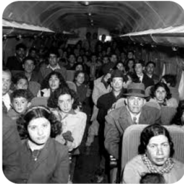
يهود عراقيون خلال نقلهم جواً إلى إسرائيل

وقد انكشف أمرهم عندما تم إلقاء القبض على خمسة من اليهود العراقيين وهم في طريقهم من العراق إلى فلسطين، من قبل السلطات العراقيّة؛ مما أدى إلى إيقاف الأنشطة العسكريّة للحركة، كما تسبب في نشوب خلافات وتراشق الاتهامات بين يهود العراق أنفسهم، وكذلك فيما بين القادة الصهاينة في فلسطين وبين زعامة يهود العراق.