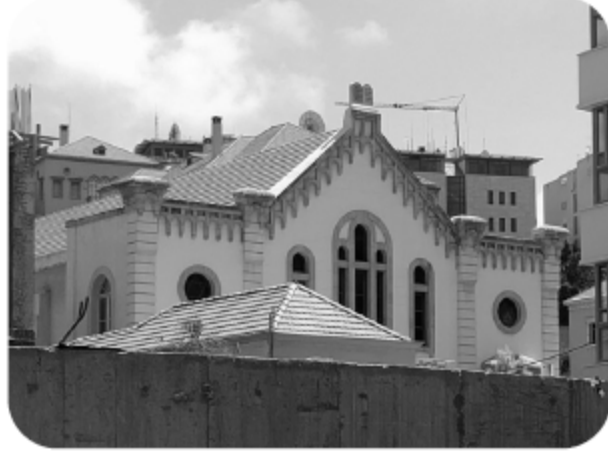
كنيس ماغين ابراهام في لبنان

تعرّض الكنيس اليهودي الرئيسي في بيروت للتفجير في أوائل الخمسينيّات من القرن العشرين