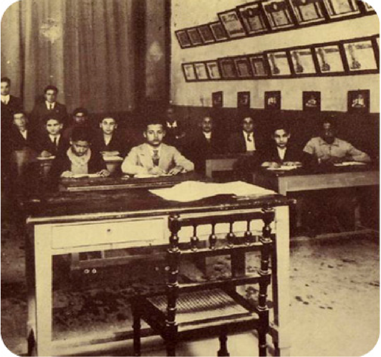
صف دراسي ليهود ليبيا في كنيس بنغازي قبل الحرب العالمية الثانية

لا تعطي المصادر التاريخية دليلاً أكيداً على تاريخ معين لقدم اليهود إلى ليبيا واستقرارهم فيها، وإن تكن مراجع تاريخية أشارت إلى أن اليهود سكنوا المدن الخمس الإغريقية والفينيقية في ليبيا ابتداءً من القرن السادس قبل الميلاد، وكان سبب مجيئهم إلى ليبيا هو التجارة والعمل في صياغة الذهب.