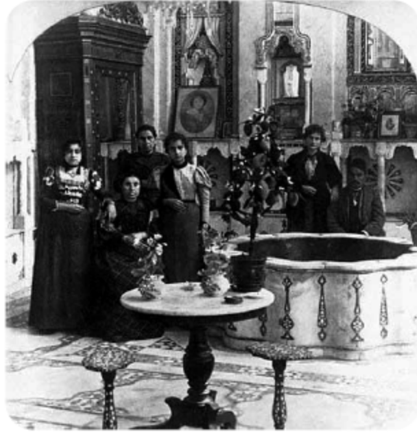
عدد من يهود سوريا في منزلهم في دمشق عام ١٩٠١

أما المجموعة الثانية من اليهود في سوريا، فهم الذين استقروا في البلاد في أعقاب طرد اليهود من إسبانيا في أعقاب سقوط الأندلس، خلال القرن السادس عشر والمعروفون باسم السفارديين. فبعد سقوط غرناطة خيّر اليهود بين اعتناق المسيحية أو الهجرة، فالذين اختاروا الهجرة انتقلت أعدادهم الكبرى إلى البرتغال والمغرب، غير أن أعداداً أخرى انتقلت إلى البلقان وأراضي الدولة العثمانية ومنها إلى الشام لا سيما دمشق، التي اكتسبت أهمية خاصة نظراً لموقعها القريب من الأراضي المقدسة. وخلال القرن التالي ستغدو المدينة أحد المعاقل الأساسية لـ«قبالة لوريا»، التي برز منها شخصيات مثل حاييم فيتال وإسرائيل نجارة.