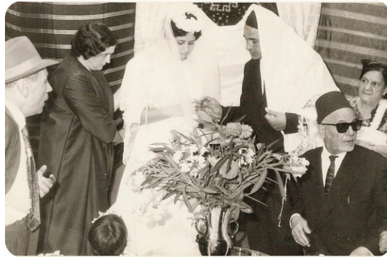
زواج يهودي في بنغازي، ليبيا، عام ١٩٥٥

وكان لوزون المثير للجدل دائمًا بتصريحات حول حق العودة للطائفة اليهودية إلى ليبيا، هدد في الأيام الماضية بالدخول في إضراب عام عن الطعام؛ ما لم يستجب سلامة لمطالبه بالجلوس معه، والموافقة على المشاركة في اجتماع جنييف ممثلًا عن «الأقلية اليهودية» في ليبيا، زاعمًا امتلاكه مبادرة لحل الأزمة.