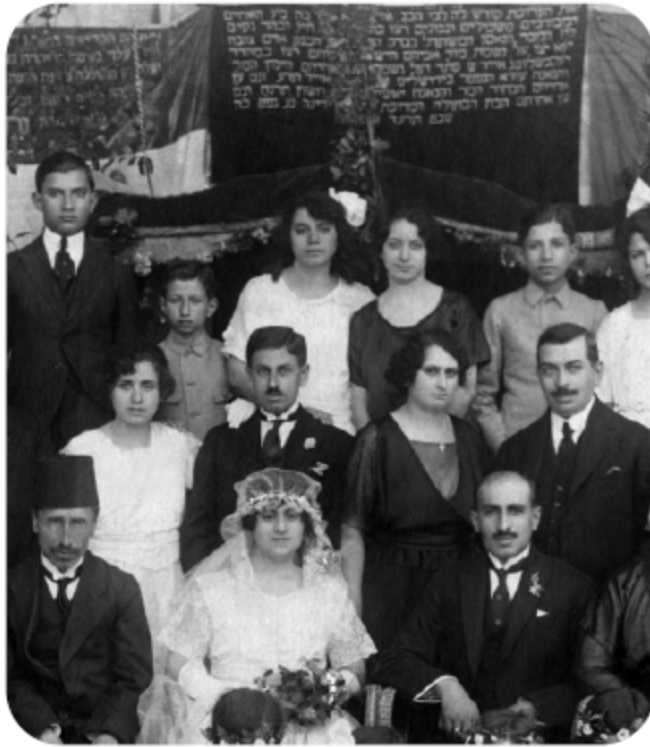
حفل زواج يهودي في حلب، سوريا، عام ١٩١٤

توزع اليهود في دمشق بين ثلاث طوائف، أولها: اليهود الربانيون، وهم أكبر طوائف اليهود عددًا، ويُعرفون بالناموسيين، والربانيم، والكتبة، وكانوا يقيمون عادةً في حي اليهود في الزاوية الجنوبية الشرقية لدمشق، داخل السور. في عام ١٢٥٦ هـ، بلغ عدد الذكور منهم ١١٣٢ رجلاً، بحسب رسالة من حاكم دمشق شريف باشا إلى محمد علي باشا في مصر (286).