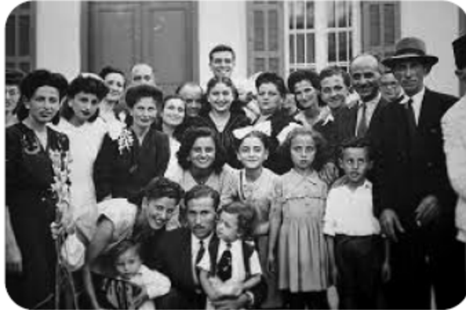
حفل زواج يهودي في كنيس ماغين أبراهام في لبنان

توجد دلائل على أن اليهود امتدوا إلى سفوح جبل الشيخ. وفي التوراة، سُمّي هؤلاء اليهود بقبائل «المنسي» والتي تعني في العبرية «الذين نسوا أنهم يهود». وكما يشير الإنجيل المسيحي إلى وجود تجمعات يهودية حول صور وصيدا وقانا؛ وذلك بناءً على قصص رحلات المسيح إلى تلك المناطق.