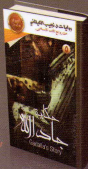
حكاية جاد الله