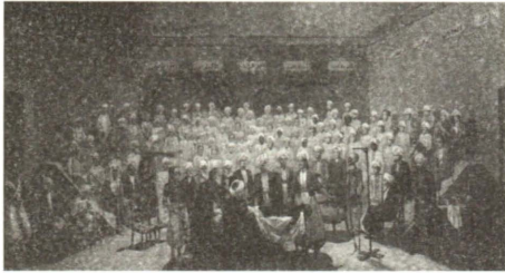
رسم رقم (١) ستريكالوفسكي، أول درس تشريح في مصر، ١٨٢٩، متحف تاريخ الطب، كلية قصر العيني، القاهرة

ومع ذلك، وعند مضاهاة لروحنا المصرية باللوحات المبكرة في عصر النهضة الأوروبية التي تجسد دروس التشريح، وخاصة تلك الدروس التي تمت في مدارس الطب الإيطالية، فإن عنصرًا أساسيًا ومركزيًا يطرح نفسه ك تفسير محتمل. هناك، في قلب تلك اللوحات الأوروبية التي رُسمت على مدى قرون، حوار مستمر إن لم نقل إنه توتر مستمر بين الجسد الذي يتم تشريحه والنص العلمي الذي يتلوه المحاضر الجالس على منبر مرتفع؛ ذلك النص الذي يرجع أصله إلى الطبيب الإغريقي جالينوس في القرن الثاني الميلادي (١) . وقد عبرت بعض الرسوم التشريحية التوضيحية الأوروبية المبكرة عن ذلك التوتر خير تعبير؛ إذ إنها «لا ترسم ما رآه عين الطالب [بقدر] ما رسمت ما كان وجوده معروفًا من قبل» (٢) . ولتبيسط الأمر يمكن القول إن ذلك التوتر كان مبعثه سؤالا مركزيا: من له القول الفصل؟ النص، أم الجثة التي يتم تشريحها؟ هل يمكن للنصوص الطبية أن تفسح مكانها للمعاينة المباشرة والحسية لجثة يجري تشريحها، أم أن دور تشريح الجثة يقتصر على إثبات صحة تعاليم الأولين؟