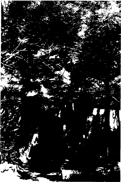
مدفن آل احمد باشا رشید