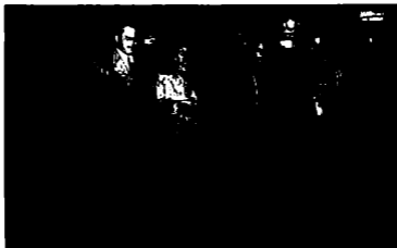
صورة مع الأسرة

للغرابية، بدأت السيدة عظيمة تسترخي أيضاً وتكلم. حكّت عن أيام المدرسة الألمانية، عن السّفرجي الذي كان يُحضر الغداء للأخوات الثلاثة في ثلاثة عواميد، وعن انطواء عنايات منذ صغرها، وعن بعض البنات التي صاحبتهنّ في المدرسة الألمانية. تعجبتُ كيف لم يخطر لي أن أذهب إلى المدرسة وأبحث عن أسماء من كانوا وقتها هناك.