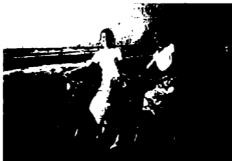
عنايات الزيات ونادية لطفي في رأس البر

فكرتُ أن الصدفة كانت تلعب أدوارًا حقيقية في ذلك الزمن. مصائر البطلات القدامى أمام الشاشة وخلفها كان يمكن أن تتحوّل إلى الشهرة أو الموت بسهولة عجيبة. كأن القدر كان في تلك الأيام مراهقًا يلهو مع جيل الانتقال بين حفلات الكوكتيل والتغيير الاجتماعي والدار القومية وجبهات عبد الناصر الفنية.